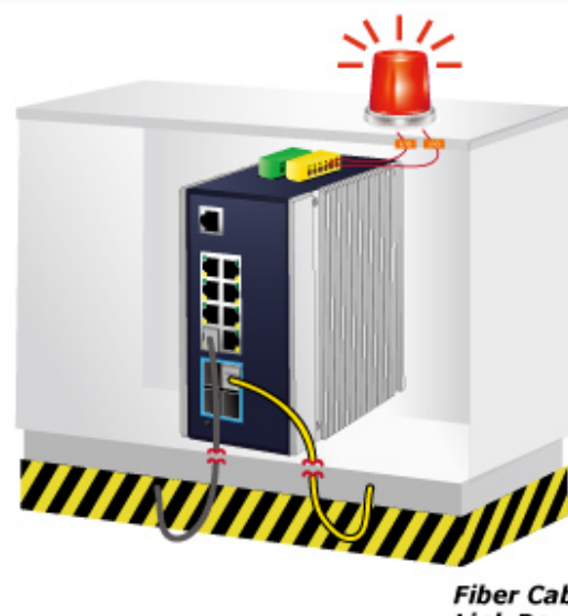
Fiber Cable Link Down