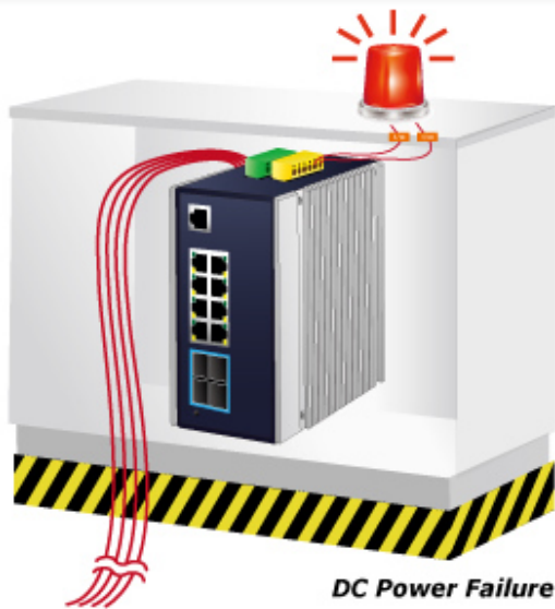
DC Power Failure