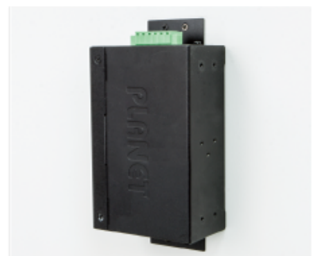
Side Wall Mounting (Space saving)