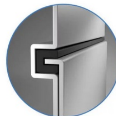
Sealed Lock-and-Key Design

Na zadní straně je k dispozici celá řada portů, mezi nimiž vyčnívá především rozhraní HDMI 2.0 , které zajistí snadné promítání 4K obsahu při vyšším jasu a kontrastu oproti standardnímu rozlišení. Jas je klíčem k viditelnosti. I proto nabízí projektor BenQ LU9245 funkci dynamického tlumení jasu dle scény a optimalizuje světelný výkon a kontrast pro co nejlepší obraz.