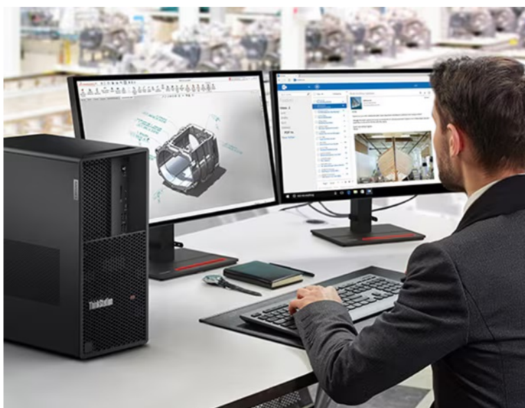
Lenovo ThinkStation P3 Tower