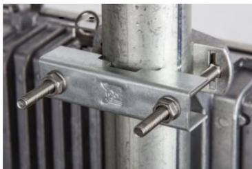
ø 21 - 54 mm třmen (součást balení T)