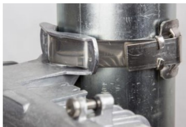
ø ≥ 19 mm nekonečný kovový pásek, spona apod. (max. šířky 19 mm, není součástí balení)