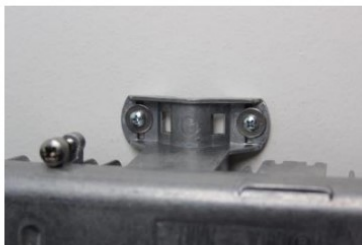
na stěnu (montážní materiál není součástí balení)