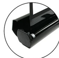
Heavy-duty aluminum case