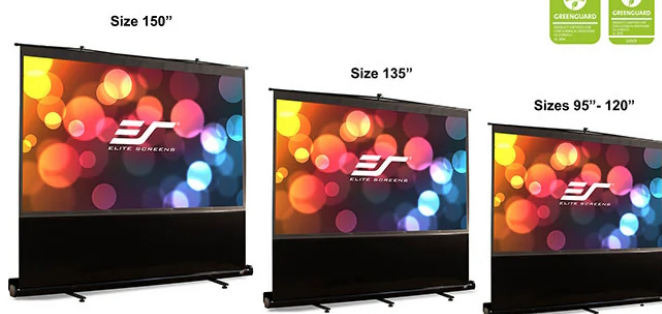
Black masking borders on all sides enhances picture contrast and absorbs minor projector overshoot

Free-Standing Portable Pull-up Projector Screen