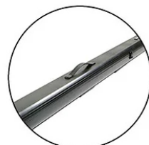
Built-in Carrying Handle for enhanced mobility