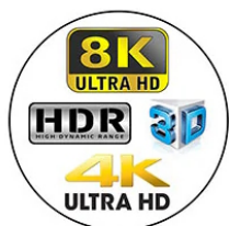
4K/8K Ultra HD, Active 3D, and HDR ready