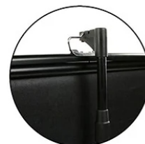
Telescoping support for variable height settings (x2 for 150" models)